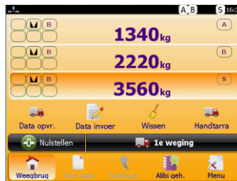
▲ Uitvoering met 2 weegsystemen

Als optie aansluiting aan twee weegsystemen