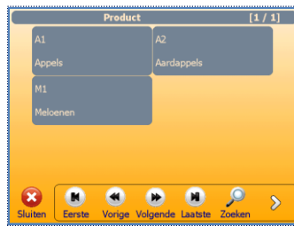
▲ Product scherm

Multi-indeling en Multi-range uitvoering met automatische omschakeling (3 x 3.000 d of 2 x 4.000 d)